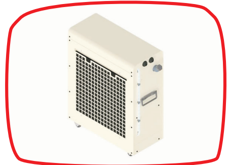
Refrigerador a água | Water cooling