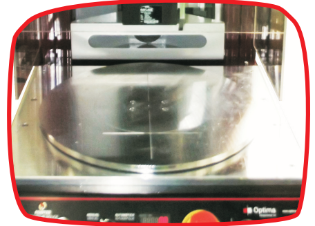
Prato rotativo (2 posições) | Rotary plate (2 positions)