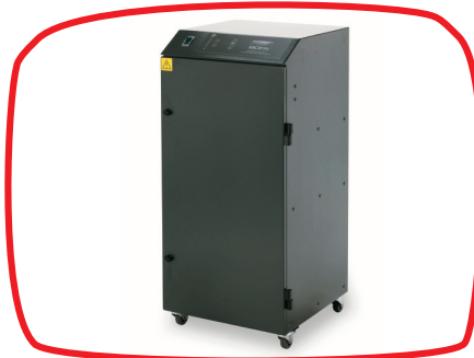
Extrator e filtragem de fumos (Bofa) | Smoke extractor and filtering (Bofa)