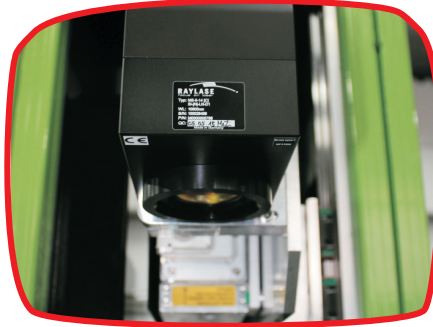
Cabeça de laser Raylase | Raylase laser head