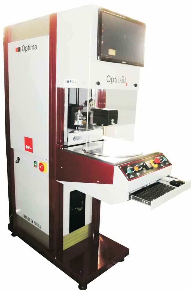
OptiLASER EP 030 005 Rotary