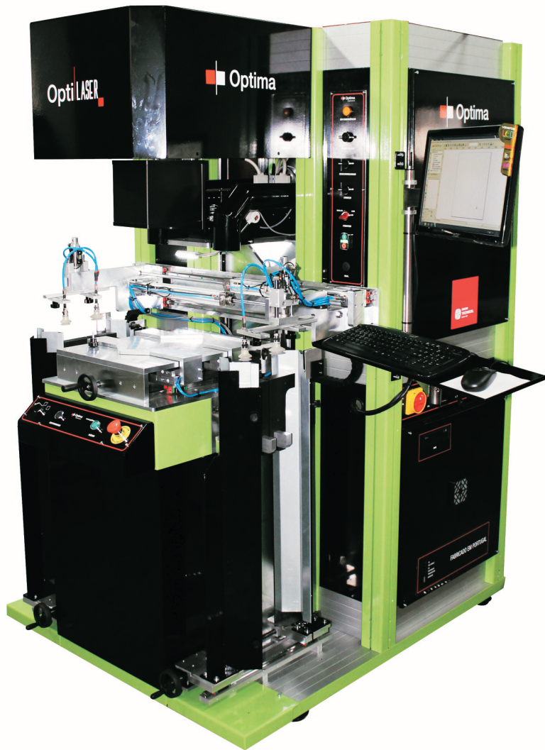
OptiLASER RF 135 001