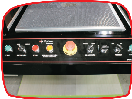
Mesa de favos | Vector grid