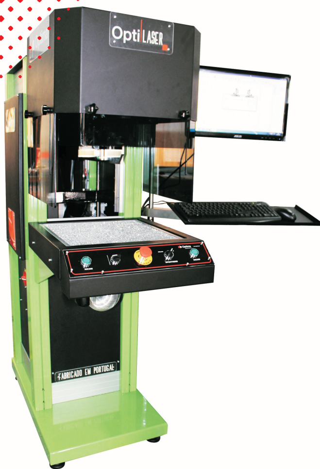
OptiLASER EP 030 005